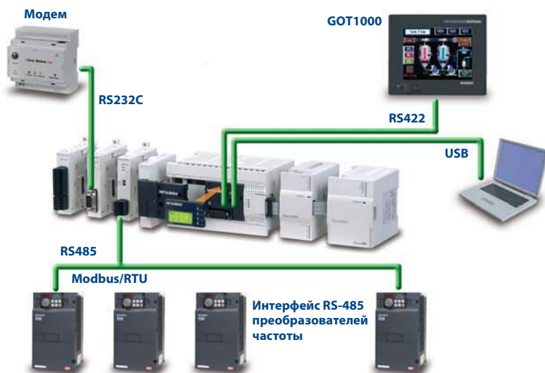
FX3G упрощает создание комплексных систем

Наконец, FX3G предоставляет широкий выбор опций, когда речь идет об организации сетей и связи: от поддержки стандартной связи по последовательным интерфейсам до всестороннего охвата распространенных открытых сетей автоматизации, включая CC-Link, CANopen, Profibus-DP и Ethernet. Кроме того, встроенный USB-порт позволяет удобно подключать ПК или ноутбук для высоко скоростной загрузки и выгрузки программ, а также мониторинга.