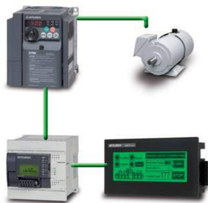
Точное управление двигателем по полевой шине

FX3G может работать как автономный контроллер, но, когда требуется интеграция с другими компонентами системы, ряд стандартных особенностей выделяет его среди прочих.