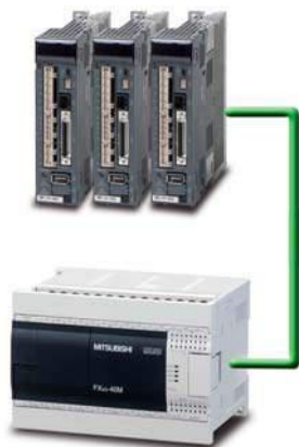
Непосредственное управление тремя сервоосями без дополнительного аппаратного обеспечения

В Mitsubishi разработаны стандартные инструкции, позволяющие просто управлять нашими преобразователями частоты по полевым шинам, обеспечивая точность и надежность.