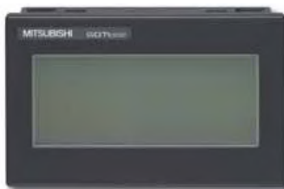
Малые размеры, но большие возможности

Панели серии GOT1000 – это семейство высокопроизводительных графических панелей управления (Graphical Operation Terminals), сочетающее широкие возможности отображения графики и функциональность в привлекательном, чрезвычайно компактном и прочном корпусе.