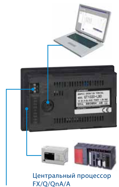
Центральный процессор FX/Q/QnA/A подключение питания (в зависимости от модели панели)

Уже на заводе-изготовителе в панели загружены все драйверы, необходимые для контроллеров семейства FX. С помощью программы GTWorks2 эти драйверы можно заменить или дополнить для работы с другими контроллерами, например, контроллерами Mitsubishi серий Q, Alpha XL, преобразователями частоты Mitsubishi, а также контроллерами сторонних изготовителей.