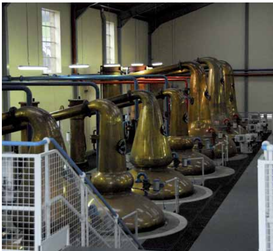
Контроль и регулирование уровней, температуры и расхода – лишь одна из разнообразных возможностей применения серии GT1020/1030.

Панели серии GOT1000 – это семейство высокопроизводительных графических панелей управления (Graphical Operation Terminals), сочетающее широкие возможности отображения графики и функциональность в привлекательном, чрезвычайно компактном и прочном корпусе.