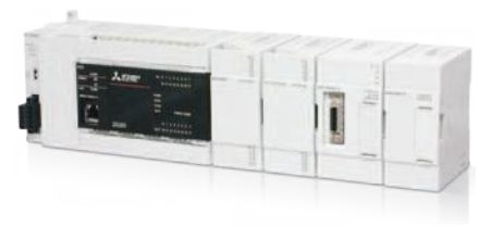
Дополнительные модули для ваших задач

Реальное положение серводвигателя можно определить путем регистрации меток, отпечатанных на пленке, движущейся на высокой скорости. Компенсация позиции оси резака на основе регистрации меток сохраняет постоянное положение резки.